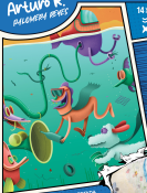
ILUSTRACIÓN DE INTERFERENCIA CON NICOLÁS B. FORTUÑO