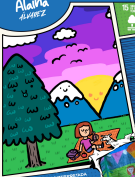
ILUSTRACIÓN DE INTERFERIDA por Betino