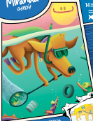
ILUSTRACIÓN DEL INTERMEDIO por Nicolás B. Forquetti