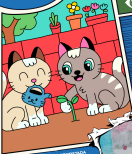
ILUSTRACIÓN DE PRESENTADA POR Makito Perrito