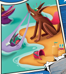
ILUSTRACIÓN DE INTERFERENCIA CON NICOLÁS B. FORTUNA