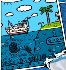
ILUSTRACIÓN DE INTERFERENCIA POR Belino