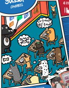
ILUSTRACIÓN DE INTERFERENCIA por Retno