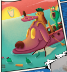
ILUSTRACIÓN DE INTERFERIDA CON NICOLÁS B. FORTUNA