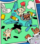
ILUSTRACIÓN DE PRESENTADA por Makito Perrito