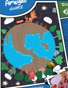
ILUSTRACIÓN DE INSPIRADA POR Betino