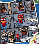
ILUSTRACIÓN DE INTERCOMICADA POR Betino