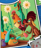
ILUSTRACIÓN DE INTERFERENCIA CON NICOLÁS B. FORTUNA