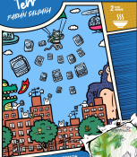
ILUSTRACIÓN DE INTERFERENCIA por Betino