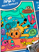
ILUSTRACIÓN DE INTERDISEÑADA CON Makito Perrito