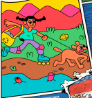
ILUSTRACIÓN DE MEXICANOS CON MALITO PERRO